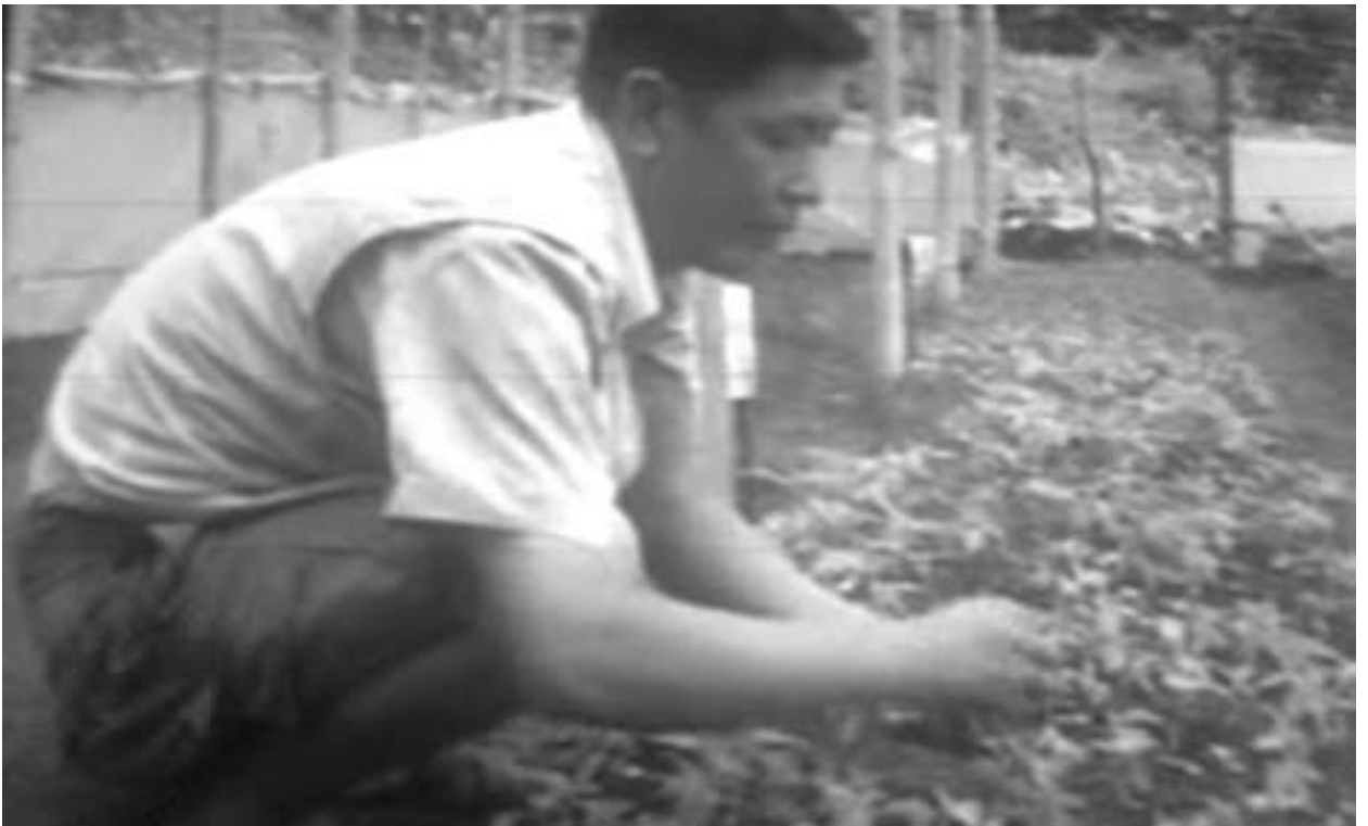
कृषक तामाङ्ग तरकारी नर्सरीका बेर्नाहरू गोड्दै

* लेखक, कृषि सूचना तथा संचार केन्द्रमा रेडियो रेकर्डिष्ट पदमा कार्यरत हुनुहुन्छ ।