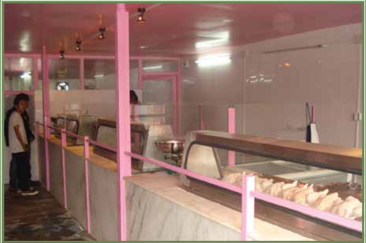
स्वस्थ मासुका लागि सुधारिएको मासु पसलबाट मासु खरिद गर्ने गरौं ।