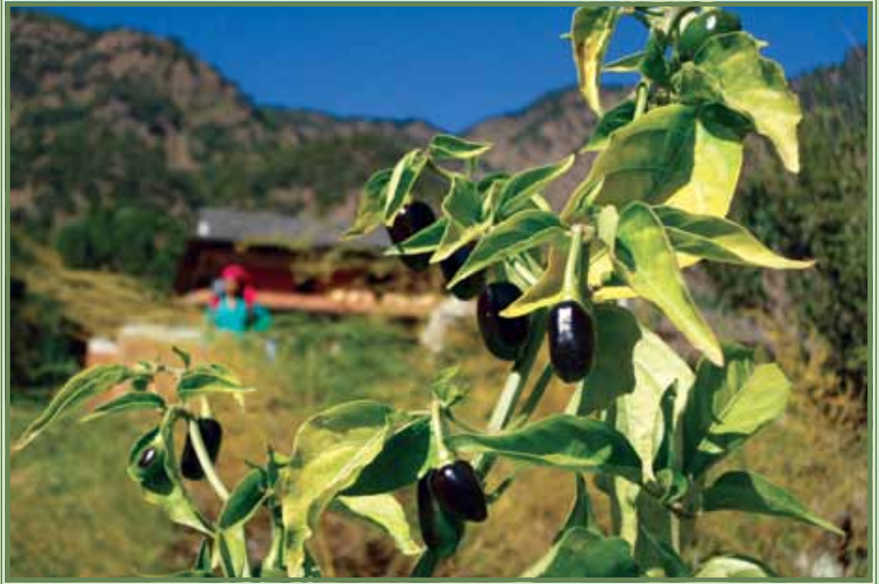
स्थानीय जातको खुर्सानी लगाऔं, जैविक विविधतालाई बचाऔं ।