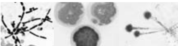
चित्र: खाद्य विषाक्त गराउने दुसीहरू

दुसीलाई प्राणी एवं वनस्पति दुवैका रूपमा चिन्न सकिन्छ । दुसीहरू सुख्खा खाद्यहरू एवं फलफूलहरूमा बढी पाइन्छन् । यी जीवहरू कम पानीमा, एवं नसुहाउँदो अवस्थामा पनि सजिलैसँग बाँच्न सक्ने भएकोले खाद्यमा यसको फैलावट रोकन विभिन्न सर्तकता जस्तै खाना सकेसम्म छोप्ने, पकाउने उपायहरू अपनाउनुपर्दछ । विशेषगरी एसपरजिलस ( Aspergillus spp. ), क्ल्याडोस्पोरियम ( Cladosporium spp. ), जियोट्रिकम ( Geotrichum spp. ) जस्ता दुसीका प्रजातीहरूले