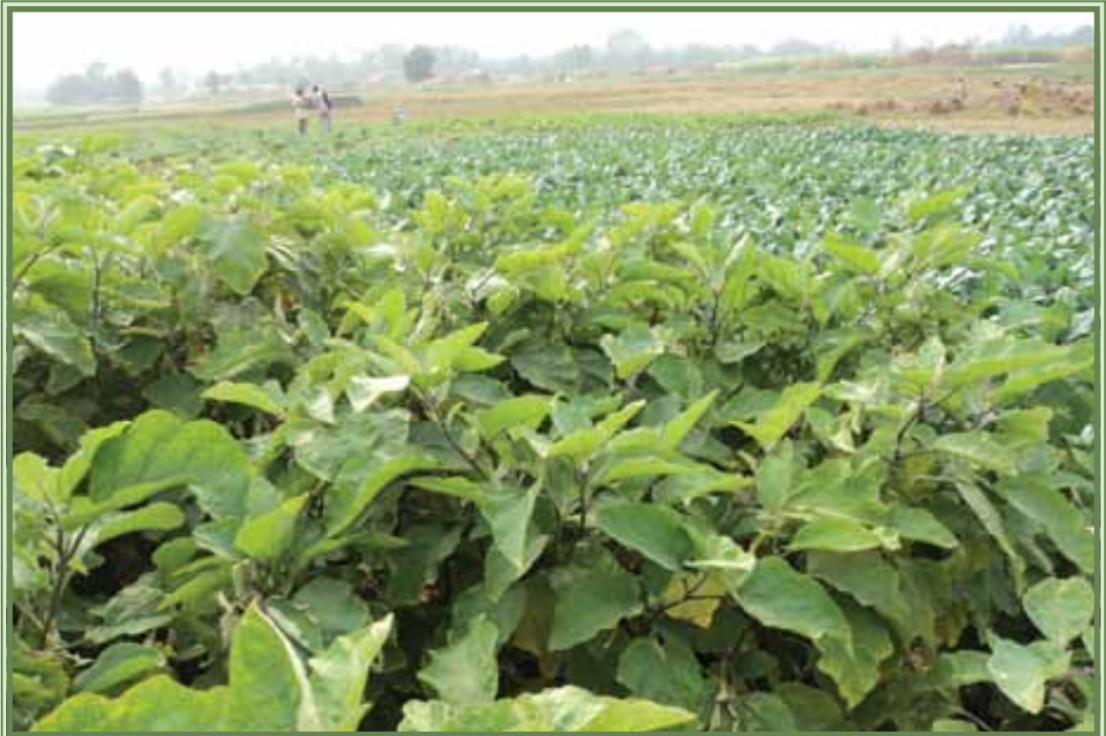
व्यवसायिक तरकारी खेती, रोजगारी र समुन्नती ।